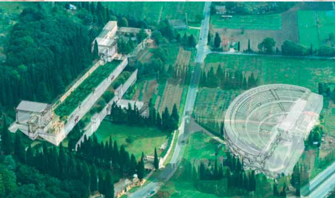
Villa Fidelia: ricostruzione Santuario Federale degli Umbri (P. Camerieri)

Consulenze storico - filologiche a cura del Dott. Andrea Cannucciari e dell'archeologa Sabina Guiducci