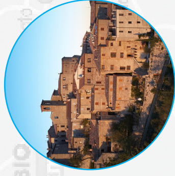
M.S. MARIA IN TIBERINA